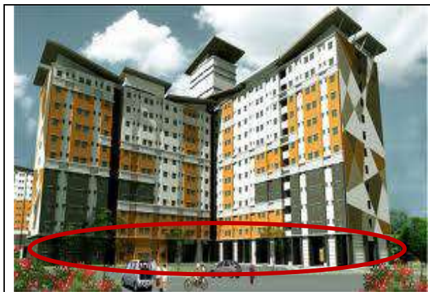
Gambar 1 : Rumah pangsa bertiang