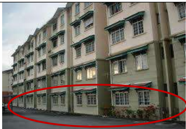
Gambar 2 : Unit aras bawah rumah pangsa